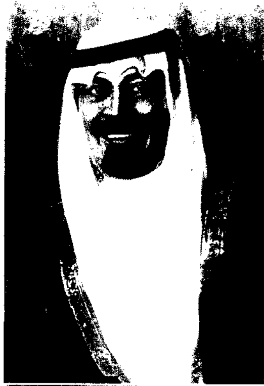
خادم الحرمين الشريفين الملك / عبد الله بن عبد العزيز